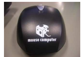
マウスコンピューターのマウス(・・)～

マウスコンピューターはBTOモデルで、説明書や解説書はほとんどついてきません。PC初心者の方にはお勧めできませんが、カスタマイズに興味のある方は、HPを覗いてはいかがでしょうか。