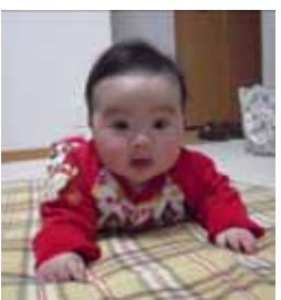
かおをあげられるようになったよ

別の日。予約していた4ヶ月健診とBCGを受けに病院へ。ここ最近、風邪でミルクの飲みがとても悪かったせいか、体重が減っていましたw(°_°)w(ほぼ平均値でした。)確かにほっぺやお腹周りがスッキリしたような...。BCGは風邪が治っていなかったので延期になりました。